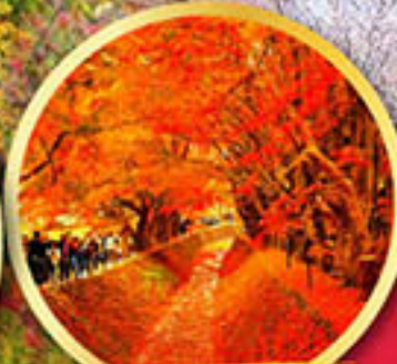
อุโมงค์ใบเมเปิ้ล โมมิจิ ไคโร