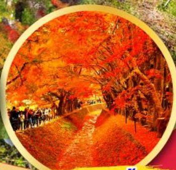
อุโมงค์ใบเมเปิ้ล โมมิจิ โคโร