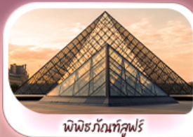
พีรามิดลูฟวร์