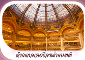
ห้างแกลเลอรีลูฟวร์