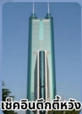
เช็กอินตึกทีห้วง