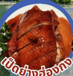
เป็ดย่างฮ่องกง