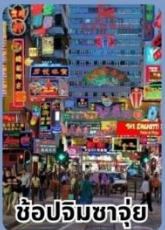
ช้อปปิ้งจางจ๋วย