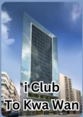
i Club To Kwa Wan