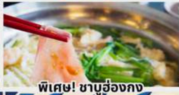
พิเศษ! ชาบูฮ่องกง