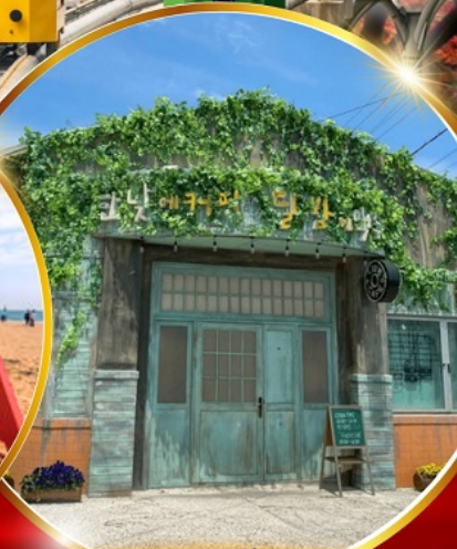
ตามรอยซีรีส์ดัง Hometown chachacha

โพฮังสเปซวอล์ก สกายวอร์ค ตามรอยซีรีส์ Hometown chachacha ถ่ายรูปชิคๆ หมู่บ้านวัฒนธรรมคิมซอน ขึ้นเคเบิลคาร์ ชมทะเลปูซาน นั่งรถไฟปุ๊กปิ๊ก sky capsule ชิมของอร่อยตลาดแฮนแด อิสระช้อปปิ้ง Lotte Duty Free