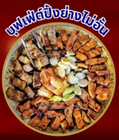
บุฟเฟ่ต์ปิ้งย่างไม่อั้น