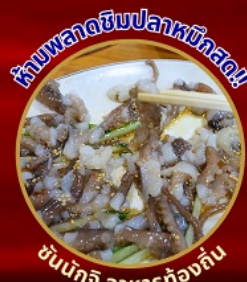
ห้ามพลาดชิมปลาหมึกสด!

โพฮังสเปซวอล์ก สกายวอร์ค ตามรอยซีรีส์ Hometown chachacha ถ่ายรูปชิคๆ หมู่บ้านวัฒนธรรมคิมซอน ขึ้นเคเบิลคาร์ ชมทะเลปูซาน นั่งรถไฟปุ๊กปิ๊ก sky capsule ชิมของอร่อยตลาดแฮนแด อิสระช้อปปิ้ง Lotte Duty Free