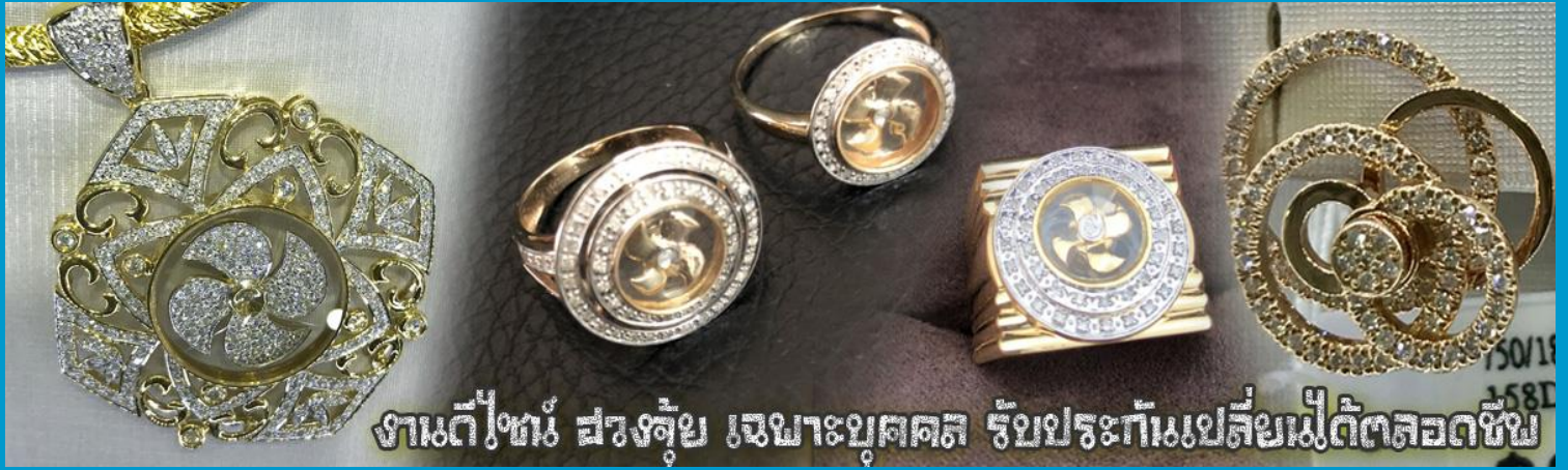
งานตีไข่มุก ฝังงาช้าง เฉากษัตริย์ รับประกันเปลี่ยนไม่ได้ตลอดชีพ

จากนั้นนำท่านสู่ ร้านหยก ชมความงามปีเซียะ ที่เชื่อกันว่าเป็นวัตถุมงคลยอดนิยม ที่มีการนำมาบูชา เพื่อให้ช่วยป้องกันสิ่งชั่วร้าย เรียกทรัพย์สินเงินทองให้ไหลมาเทมา และกักเก็บทรัพย์นั้นไม่ให้รั่วไหลออกไปไหนได้ ชาวจีนโบราณเชื่อกันว่า ปีเซียะเป็นสัตว์ประหลาดที่รวมลักษณะของสัตว์มงคลทั้ง 5 ชนิดไว้ด้วยกัน ได้แก่ มังกร พญาราชสีห์หรือสิงโต, อินทรี, กวาง, และแมว โดยตามตำนานเล่าว่า ปีเซียะเป็นลูกมังกรตัวที่ 9 (เทพแห่งโชคลาภ) ของพญามังกรสวรรค์ มีชื่อเรียกด้วยกันหลายชื่อไม่ว่าจะเป็น “เทียนลก (กวางสวรรค์)” เป็นชื่อเดิม ส่วนจีนกวางตุ้งจะเรียกว่า “เผ่เย้า” และคนจีนแต้จิ๋วจะเรียกว่า “ผีซิว”