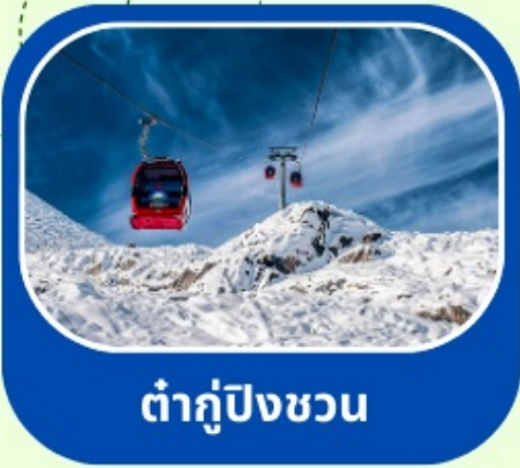
ต้ากู่ปังชวน