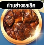
ทำอย่างฮกเก้ง