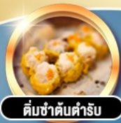
ต้มซ่าตันตำรับ