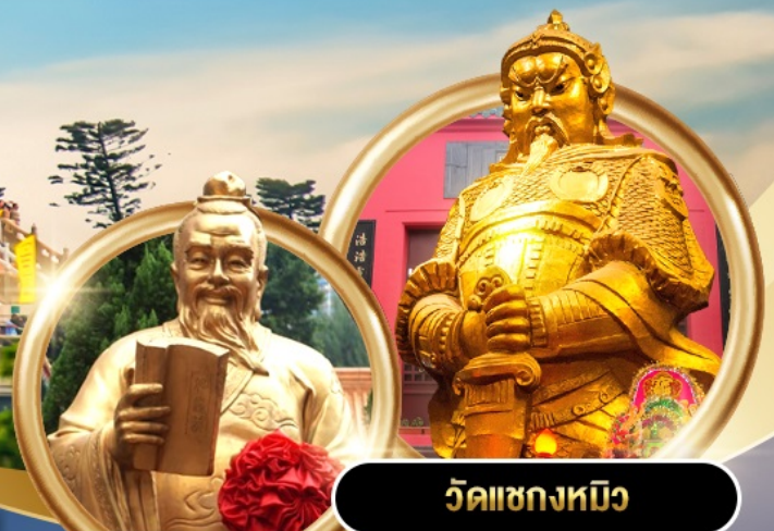
วัดเซกกงหมิว