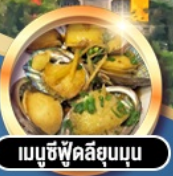
เมนูซีฟู้ดลิขุนบน