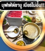
บุฟเฟ่ต์ชาบู เบียร์ไม่อั้น!!