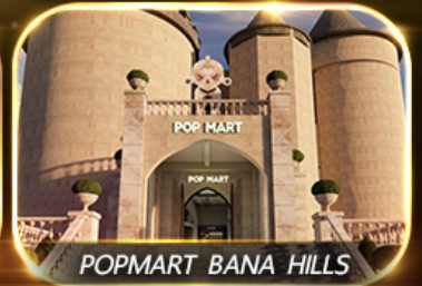
POPMART BANA HILLS

สัมพัสความงามหมู่บ้านฝรั่งเศสที่บานาฮิลล์ ซอปปิง POPMART