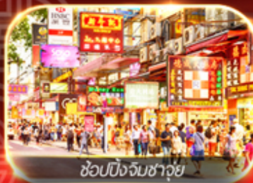
ช้อปปิ้งจิมซาจุ้ย