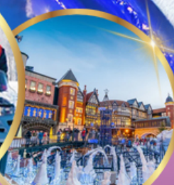
โรงงานช็อคโกแลต ชิโรอิ โคอิมีโตะ