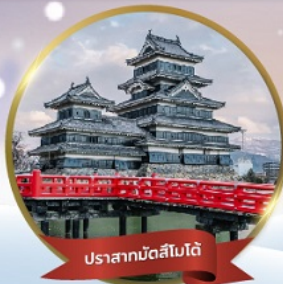
ปราสาทมัตสึโมโต้