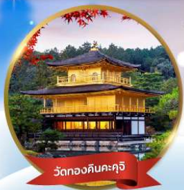
วัดทองคินคะคุจิ