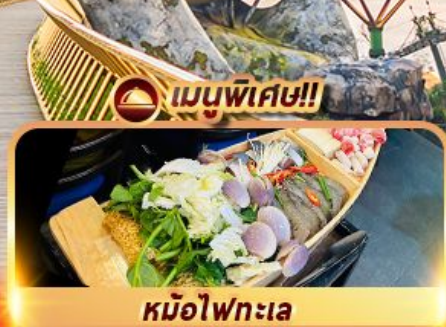
หม้อไฟทะเล