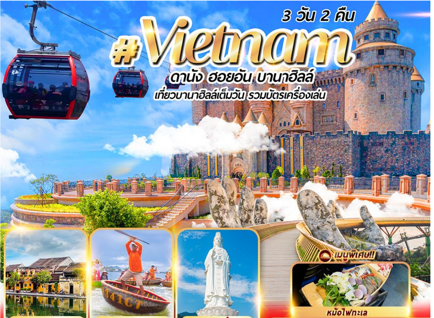
เมืองมรดกโลกฮอยอัน

ดานัง ฮอยอัน บานาวิลล์ เที่ยวบานาวิลล์เต็มวัน รวมบัตรเครื่องเล่น