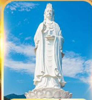
วัดหลินอิ่ง