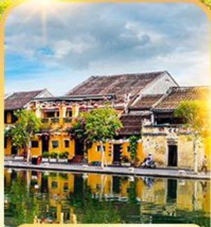
เมืองมรดกโลกฮอยอัน

ดานัง ฮอยอัน บานาฮิลล์ เที่ยวบานาฮิลล์เต็มวัน รวมบัตรเครื่องเล่น