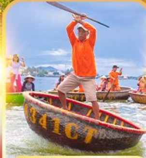
ล่องเรือกระดัง