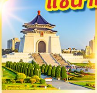
อนุสรณ์เจียงไคเช็ค

นั่งรถไฟปองปอง! ชมวิวที่ฝิงซาน แช่น้ำแร่ร้อนตัวในห้องพัก