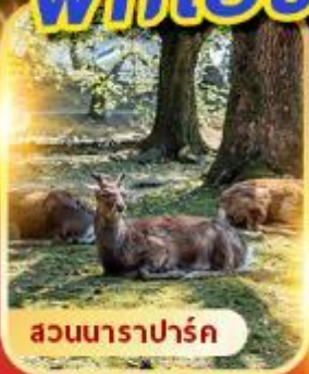
สวนนาราปาร์ค