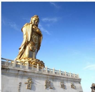
เกาะผู้ไถวซาน