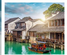
เมืองโบราณอูเจิน