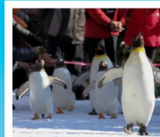
สวนสัตว์นิกเซ่

วัดคิตสึโอจิ / ปราสาทโอซาก้า / ย่านชินไซบาชิ ค่องเรือทะเลสาบโทยะ / โทเรียวคะคุ ทาวเวอร์ โกดังอิฐแดงคานโมริ / นังกระซำภูเขาฮาโกดาเตะ ตลาดเช้าเมืองฮาโกดาเตะ / สวนสัตว์นิกเซ่ มารีนิพาร์ค พิพิธภัณฑ์ค่องดนตรี / นาฬิกาไอน้ำโบราณ โรงเป่าแก้วคิตาอิชิ / เนินพระพุทธรเจ้า / มิซึย เอ้าเค็ทท์