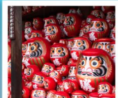
วัดคิตสึโอจิ