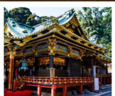
ศาลเจ้าคุโนซังโทโชกุ