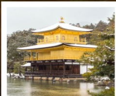
ปราสาททองคิงคะคุจิ

ปราสาททองคิงคะคุจิ / ศาลเจ้าฟูชิมิ อิฮาริ / จุดชมวิวนิฮอนงโงโระ / ศาลเจ้าคุโนซังโทโชกุ / โทเกมบะ พริเมียม เอ้าท์เล็ตส์ โอซึโนะ ฮักโก / เมืองควาโทเกะ / ตระกูลคาซึยะโยโคโจ / ย่านคุระซึคุริ / ตลาดคริสต์มาสโตเกียว / ตลาดปลาซึกิจิ / วัดอาซากุสะ