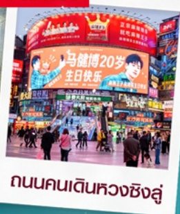
ถนนคนเดินหวงซิงสู่