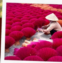
หมู่บ้านรูฟ