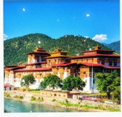
พูนาคาซอง