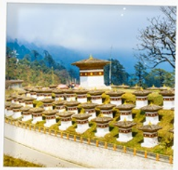
จุดชมวิวโตซูล่า

พิชิตยอดเขาวัดทักซัง พลังศรัทธาของชาวพุทธ เที่ยวครบ เมืองพาโร ทิมพู พูนาคา