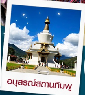
อนุสรณ์สถานทิมพู