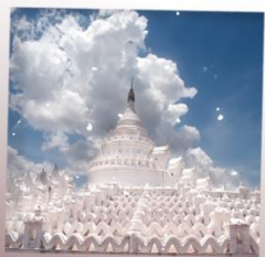
เจดีย์ชินพิวมิน