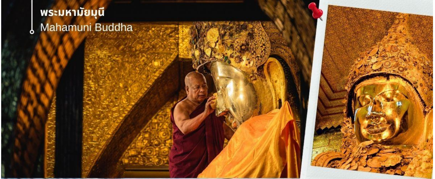
พระมหาามัยมูณี Mahamuni Buddha

เป็นพระพุทธรูปที่มีชีวิต ด้วยเหตุที่ได้รับประทานพร หรือบางตำนานก็กล่าวว่าได้รับประทานลมหายใจจากพระพุทธเจ้า จึงมีประเพณีล้างพระพักตร์ถวายโดยทุกเช้าในเวลาประมาณ 04.00 น. พระมหาเถระและสาธุชนทั่วไปที่ศรัทธาจะมาทำพิธีล้างพระพักตร์ด้วยน้ำอบน้ำหอมผสมทานาคาอย่างดี พร้อมกับใช้แปรงทองแปรงที่พระโอษฐ์เสมือนหนึ่งแปรงพระทนต์ถวายพระพุทธเจ้า ก่อนใช้ผ้าจากศรัทธาสาธุชนที่ถวายมาเช็ดจนแห้งสนิท แล้วนำกลับคืนแก่สาธุชนผู้นั้นไปบูชาต่อ พร้อมใช้พัดทองโบกถวายเป็นอันดี เสมือนหนึ่งได้อุปัฏฐากองค์สมเด็จพระสัมมาสัมพุทธเจ้าที่ยังทรงพระชนมชีพอยู่ พระมหาามัยมูณีมีอีกพระนามหนึ่งว่า "พระเนื้อนุ่ม" ซึ่งเกิดจากการปิดทองซ้ำแล้วซ้ำอีกจนเป็นรอยย่นตะปุ่มตะป่ำไปทั่วทั้งองค์ ซึ่งหากเอานิ้วกดลงไปจะรู้สึกได้ถึงความอ่อนนุ่มของทองคำเปลวที่ปิดทับซ้อนกันนับเป็นพัน ๆ หมื่น ๆ ชั้น สมควรแก่เวลานำท่านเดินทางกลับเข้าสู่ที่พัก