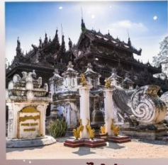
วิหารไม้สัก เขตตานจอง