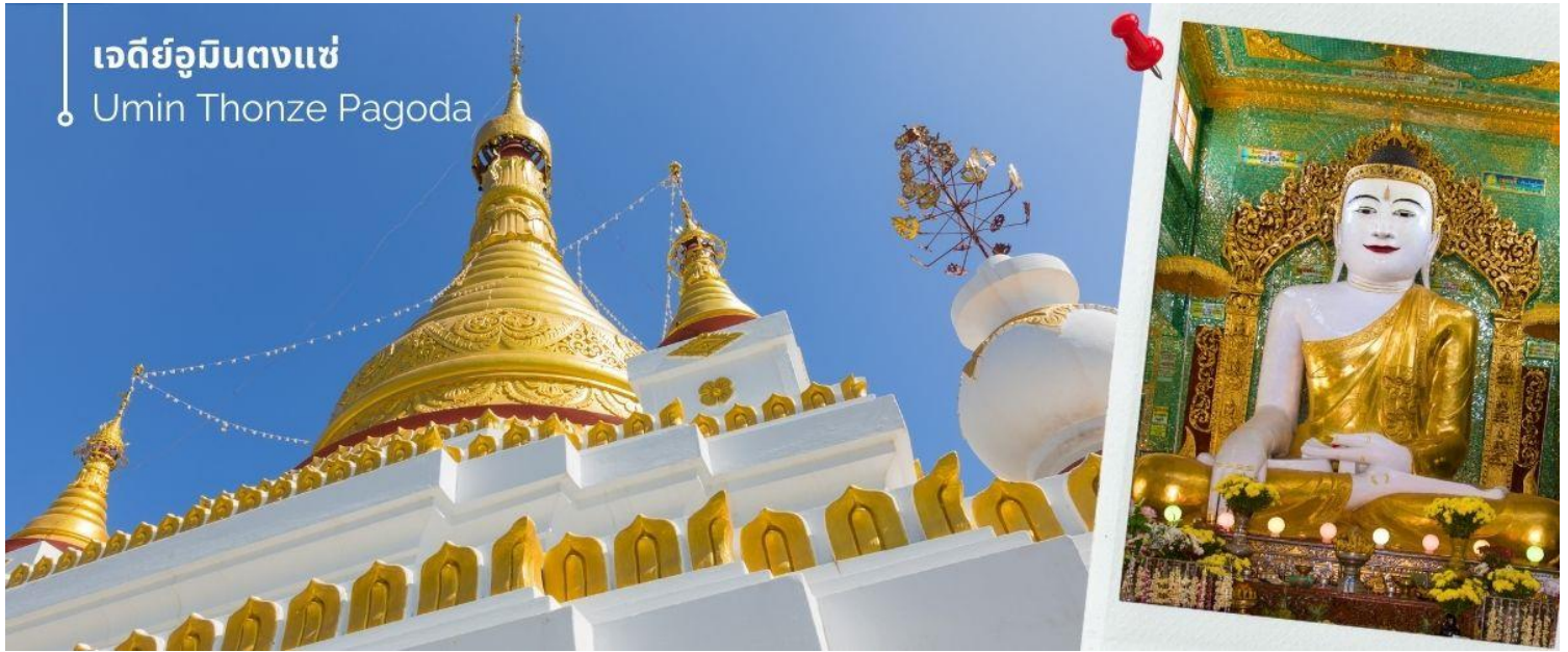
เจดีย์อุมินตงแซ่ Umin Thonze Pagoda

จากนั้นนำท่านชม เจดีย์อุมินตงแซ่ ขอพร พระทันใจ (Umin Thonze Pagoda) ตั้งอยู่ที่ดอยสุริยะอุมินตงแซ่ อยู่ห่างเหนือประมาณ 1200 เมตร เป็นวัดผสมผสานที่มีชื่อเสียงที่สุดคือ ทางเดินรูปพระจันทร์เสี้ยว ภายในมีพระพุทธรูป 45 องค์ ทางเดินรูปพระจันทร์เสี้ยวทั้งหลังมีซุ้มประดับประดาสวยงามทั้งหมด 30 ซุ้ม หมายถึง ถ้ำที่พระสงฆ์หนึ่งสมาธิ ส่วนชื่อวัด อุมิน แปลว่า ถ้ำ ตงแซ่ หมายถึง 30 ด้าน ด้านข้างทางเดินมีพระวิหารสี่เหลี่ยม ภายในประดิษฐานพระพุทธรูปขนาดต่างๆ กว่าสิบองค์ บนเนินเขาด้านหลังทางเดินยังมีกลุ่มพระอุโบสถและเจดีย์ที่มองเห็นทิวทัศน์ที่สวยงามของภูเขาสุริยะและแม่น้ำอิรวดี