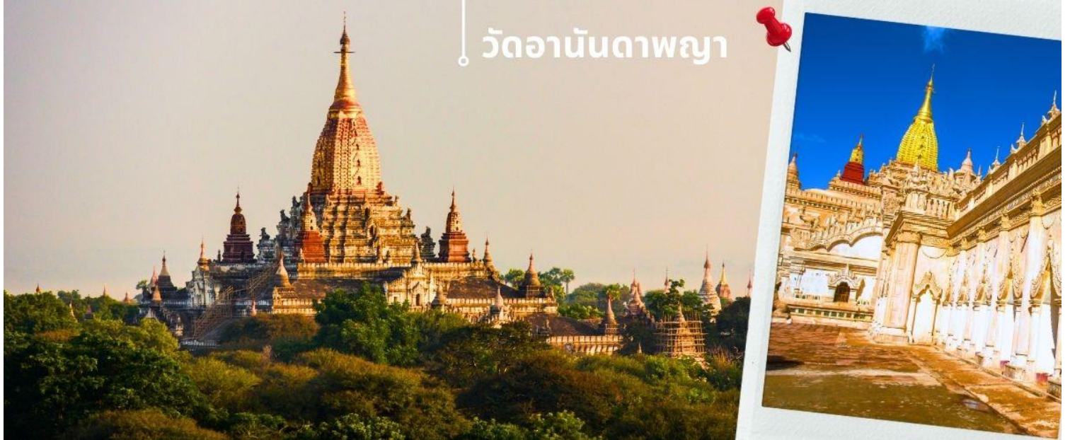
วัดอานันดาพญา

จากนั้นนำท่านนมัสการ วัดอานันดาพญา คือมหาวิหารขนาดใหญ่ที่ตั้งอยู่ในเมืองพุกาม ประเทศพม่า เริ่มสร้างขึ้นใน พ.ศ. 1633 แล้วเสร็จในปีต่อมา ในรัชกาลพระเจ้าจันชิต้า มีความสำคัญในฐานะได้รับการยกย่องว่าเป็น "เพชรน้ำเอกของพุทธศิลป์ สกulptural พุกาม" ในอดีตยอดพระเจดีย์ยังเป็นสีขาวเหมือนกับพระเจดีย์องค์อื่นๆ ของพุกาม แต่รัฐบาลพม่าได้มาทาสีทองทับเมื่อ พ.ศ. 2533 เพื่อสมโภชการสร้างวัดอานันดาพญา ครบรอบ 900 ปี อานันดาพญา เป็นพระเจดีย์ที่สามารถเดินเข้าไปข้างในได้ แผนผังเป็นรูปสี่เหลี่ยมจัตุรัสมีมุขยื่น 4 ทิศ ประตูทางเข้าเป็นประตูโค้ง ที่มักพบเห็นในสถาปัตยกรรมตะวันตกมากกว่า ตะวันออก ภายในประดิษฐานพระพุทธรูปประทับยืนไม้ปิดทอง สีทศ สี่องค์ สูง 9.5 เมตร