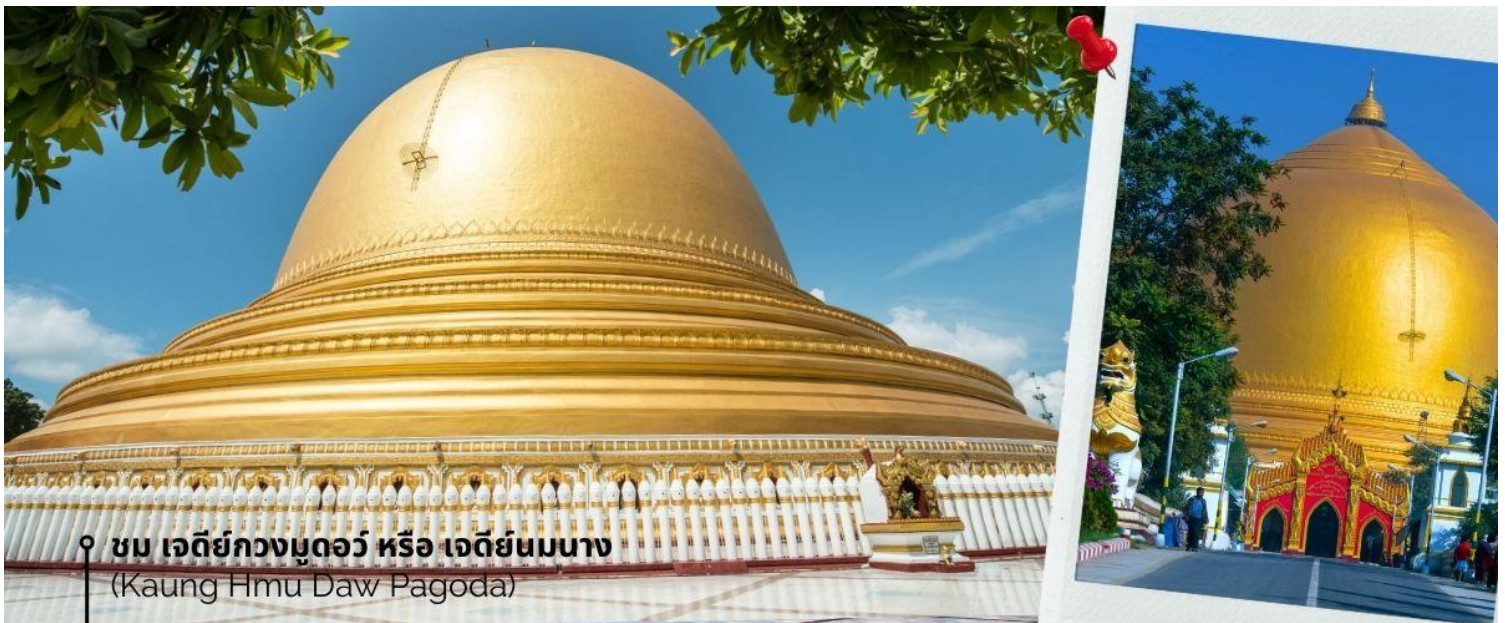
ชม เจดีย์กวงมุดอว์ หรือ เจดีย์นมนาง (Kaung Hmu Daw Pagoda)

นำท่านชม เจดีย์กวงมุดอว์ หรือ เจดีย์นมนาง (Kaung Hmu Daw Pagoda) เป็นเจดีย์พุทธขนาดใหญ่ ตั้งอยู่เขตชานเมืองทางตะวันตกเฉียงเหนือของชะไก้ โดยจำลองตามสัณฐานมาลีมหาเจดีย์ในประเทศศรีลังกา ฐานชั้นล่างสุดของเจดีย์ประดับด้วยนระและเทวดา 120 องค์ ล้อมรอบด้วยโคมหิน 802 ต้น ซึ่งแกะสลักพร้อมจารึกพุทธประวัติสามภาษาได้แก่ พม่า, มอญ และไท