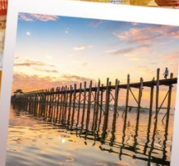
สะพานไม้จูปิง