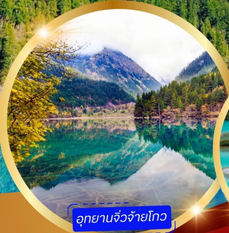
อุทยานจิวโจโกว