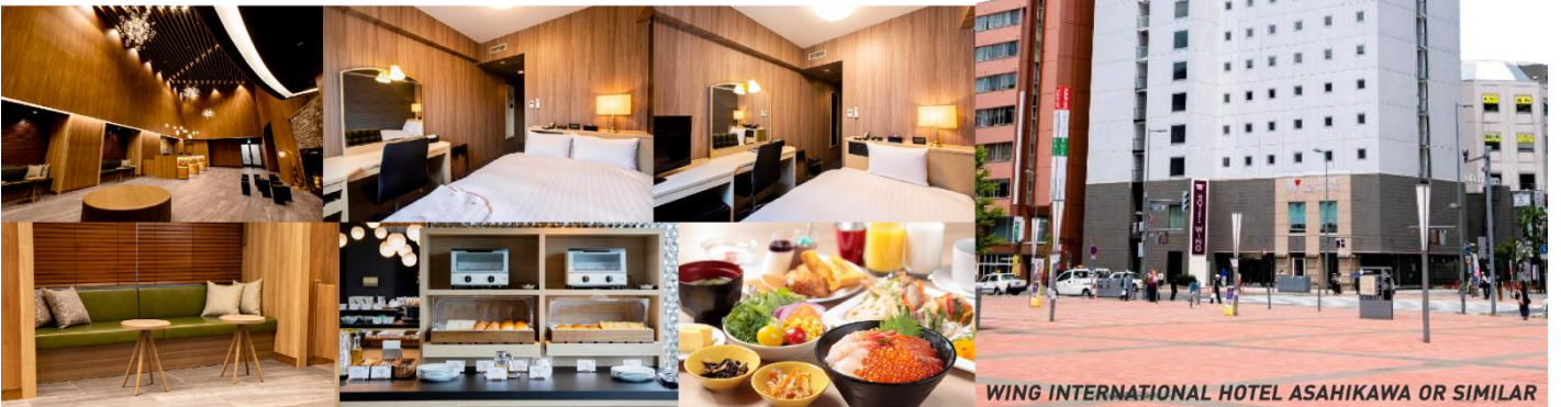
WING INTERNATIONAL HOTEL ASAHIKAWA OR SIMILAR

ที่พัก WING INTERNATIONAL HOTEL หรือ ART ASAHIKAWA, หรือเทียบเท่า