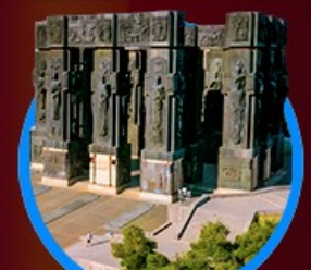
อนุสาวรีย์ประวัติศาสตร์

48,888 23-28 ต.ค. 67 เหลือ 10 ที่ 41,111