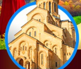
โบสถ์กรินดี เมืองทบิลีซี