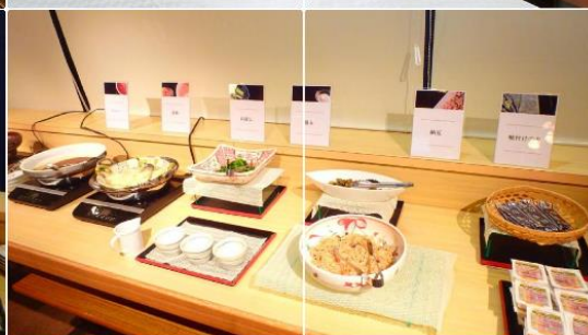
Sendai Business Hotel Ekimae