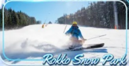
Rokko Snow Park