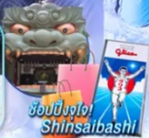
ช้อปปิ้งจุใจ! Shinsaibashi