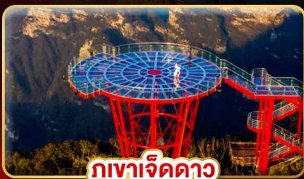
ภูเขาจิดดาว

สัมผัสเสน่ห์จากเจียเจีย มหิศจรรย์ทางธรรมชาติ