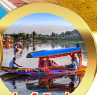
ล่องเรือซิคาร์่า