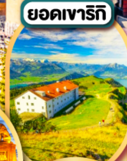
ยอดเขารีกี