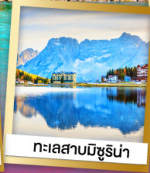
ทะเลสาบมิซูรีน่า