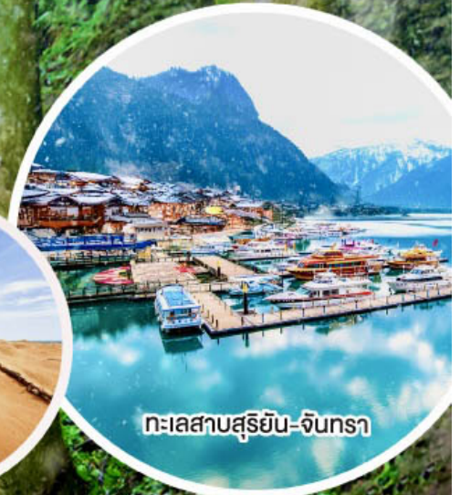
ทะเลสาบสุริยอัน-จินทรา