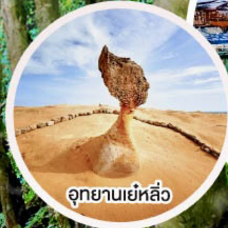
อุทยานเย่หลิว