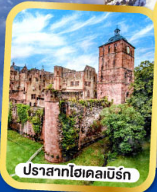
ปราสาทไชเคลเบิร์ก