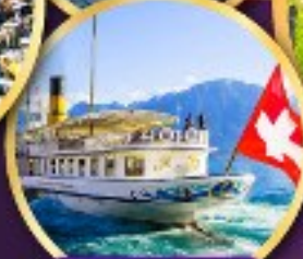
ส่องเรือ ทะเลสาบเจนีวา