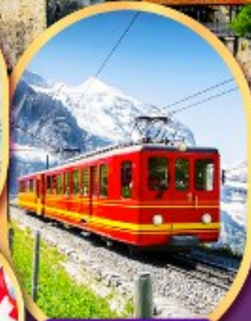
รถไฟคู่ ยอดเขาจุงเฟรา