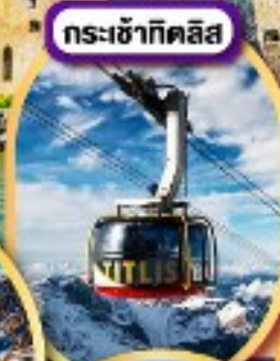
กระเช้ากิตลิส