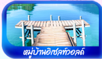
หมู่บ้านอิเซลท์วอลด์