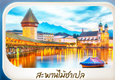
สะพานไม้ชาเปิล