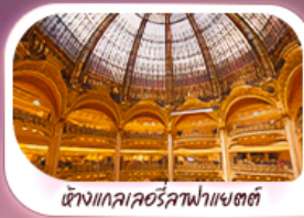
ตึกแกลเลอรีลูฟวร์