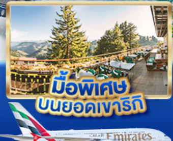
มือพิเศษ บินยอดเขารัก