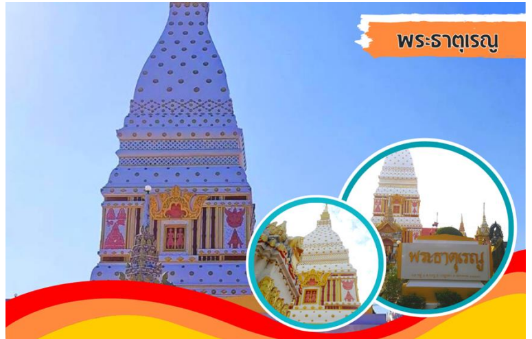
พระธาตุเรณู

นำท่านเดินทางไปยัง พระธาตุ เรณู พระธาตุประจำวันเกิดวัน จันทร์ พระธาตุเรณู ประดิษฐาน ณ วัดธาตุเรณู อ.เรณู ภายในบรรจุ พระไตรปิฎก พระพุทธรูปเงิน พระพุทธรูปทองคำ ของมีค่า มากมาย และเครื่องกฤษณ์ภัณฑ์ของ พระยาและเจ้าเมือง ของนครพนม เชื่อว่าผู้ใดได้ไปสักการะจะได้รับ