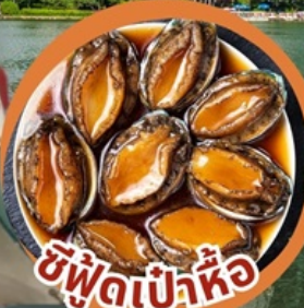
ซีฟู้ดเป่าหื้อ