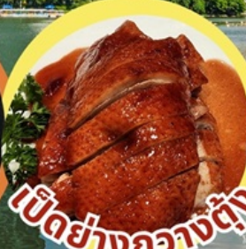
เป็ดย่างกวางตุ้ง