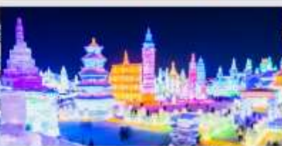
เทศกาลโคมไฟน้ำแข็ง