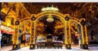
ถนนคนเดินจงหยาง