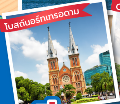
โบสถ์นอร์ทเทรอดาม