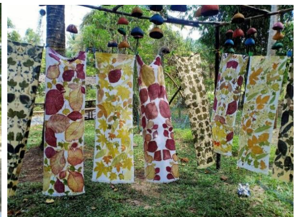
จากนั้น แวะชมศูนย์หัตถกรรมกลุ่มกะลามะพร้าว ผลิตภัณฑ์จากกะลามะพร้าว