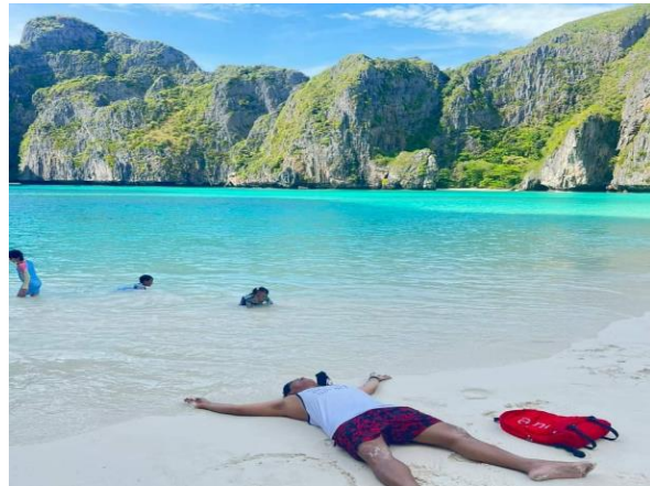
จากนั้นนำท่านไปชม อ่าวปิละ ถ่ายภาพกับความงามของลากูน