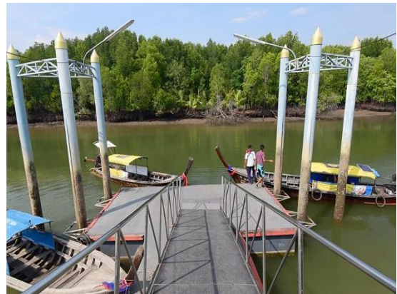
นั่งเรือลอดอุโมงค์ป่าโกงกาง ชมธรรมชาติ ของปากกลางน้ำแหล่งเพาะพันธุ์ปลากะปิ