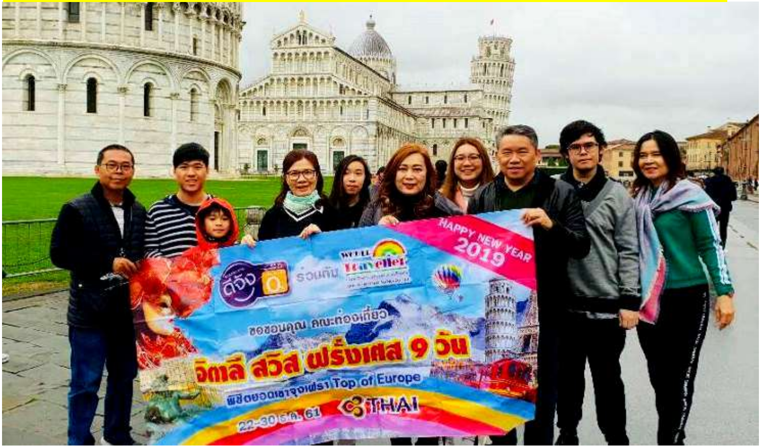
อิตาลี-สวิสเซอร์แลนด์-ฝรั่งเศส 9วัน TG PROMOTION4 เดินทาง 15-23 ธ.ค.2561(จำนวน32ท่าน)