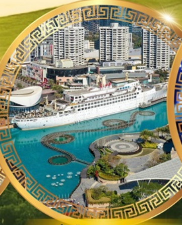
ท่าเรือ Sea World