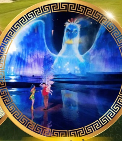
การแสดงม่านน้ำ