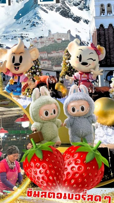
ตลาดกวางจ้ง