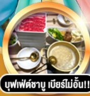
บุฟเฟ่ต์ชาบู เมียร์ไม้อัน!!