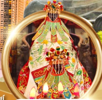
ยืมเงินเจ้าแม่กวนอิมสองห้า