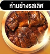
ห่านย่างสลิส