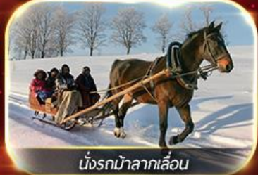
นั่งรถม้าลากเลื่อน

ฟรีนั่งรถม้าลากเลื่อน ชมโชว์ว่ายน้ำน้ำแข็ง แม่น้ำชงหวาเจียง