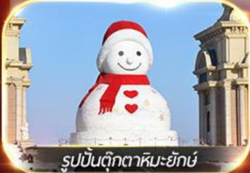
รูปปั้นตุ๊กตาหิมะยักษ์