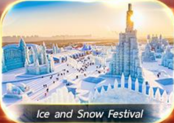
Ice and Snow Festival