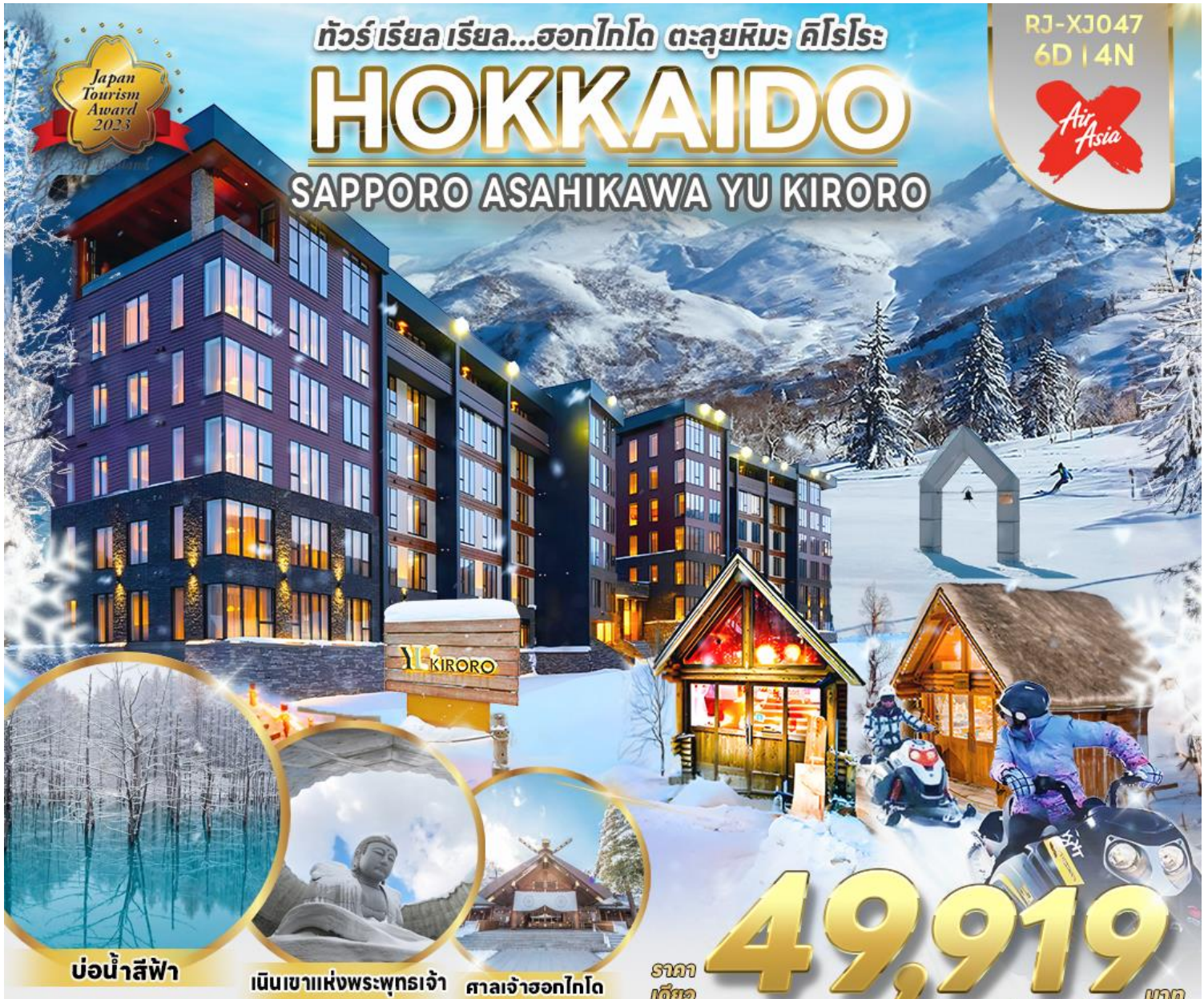
บ่อน้ำสีฟ้า