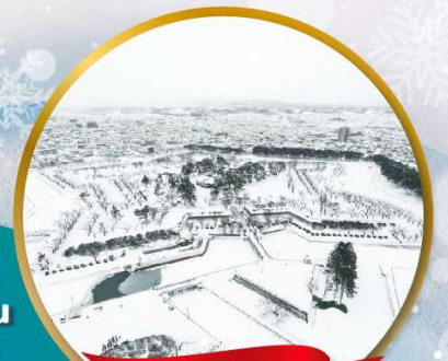
ป้อมโกเรียวกากุ

หมู่บ้านนิงเกิลเกอเรส • สวนสัตว์อาซาฮิยาม่า • ชมบวนพาเหรดเพนกวิน ตลาดเช้าฮาโกดาเตะ • ป้อมโกเรียวกากุ • นั่งกระเช้าชมเมืองฮาโกดาเตะ ลานสกี • HILL OF BUDDHA • ไอตารุ • คลองไอตารุ • หมู่บ้านราเมน