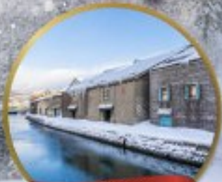
คลองโฮตารุ

13-19 ม.ค. 2568 20-26 ม.ค. 2568 27 ม.ค.- 2 ก.พ. 68