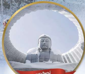
พระใหญ่ HILL OF BUDDHA